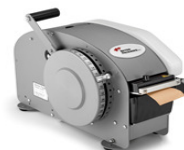
BP333 Plus con calentador