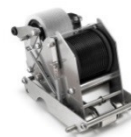
Encintador para códigos